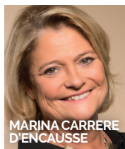
MARINA CARRÈRE D'ENCAUSSE